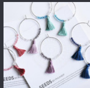
SEEDS BY PHUHIET (From Vietnam)

本年春に引き続き、東京日本橋のエシカル商品の セレクトショップエシカルペイフォワードが 鎌倉でPOP-UP SHOPを開催します。 秋冬のお出かけにぴったりの身も心も温まる商品 を取り揃えて皆様のお越しをお待ちしております。 ぜひご来店ください。